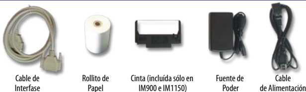
Cable de Interfase